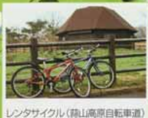
レンタサイクル(蒜山高原自転車道)